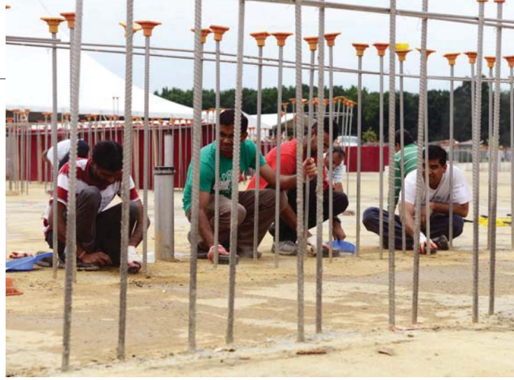
વિષમ મોસમમાં પણ મંદિરના સર્જનકાર્યમાં સાથ આપવા ઉપરાંત હરિભક્તો-મહિલાઓએ શણગારથી લઈને કિચન સુધીની કામગીરી સંભાળી લીધી.